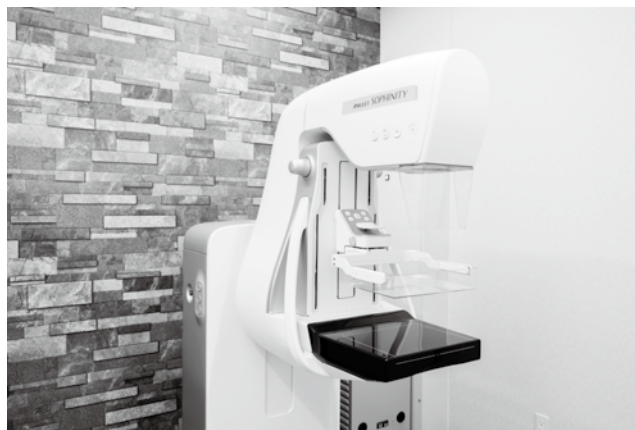
放射線科 技師長 藤本佳文