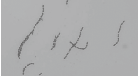
ハシモトネンシスの顕微鏡画像