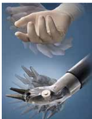
人の手のような自由な動き