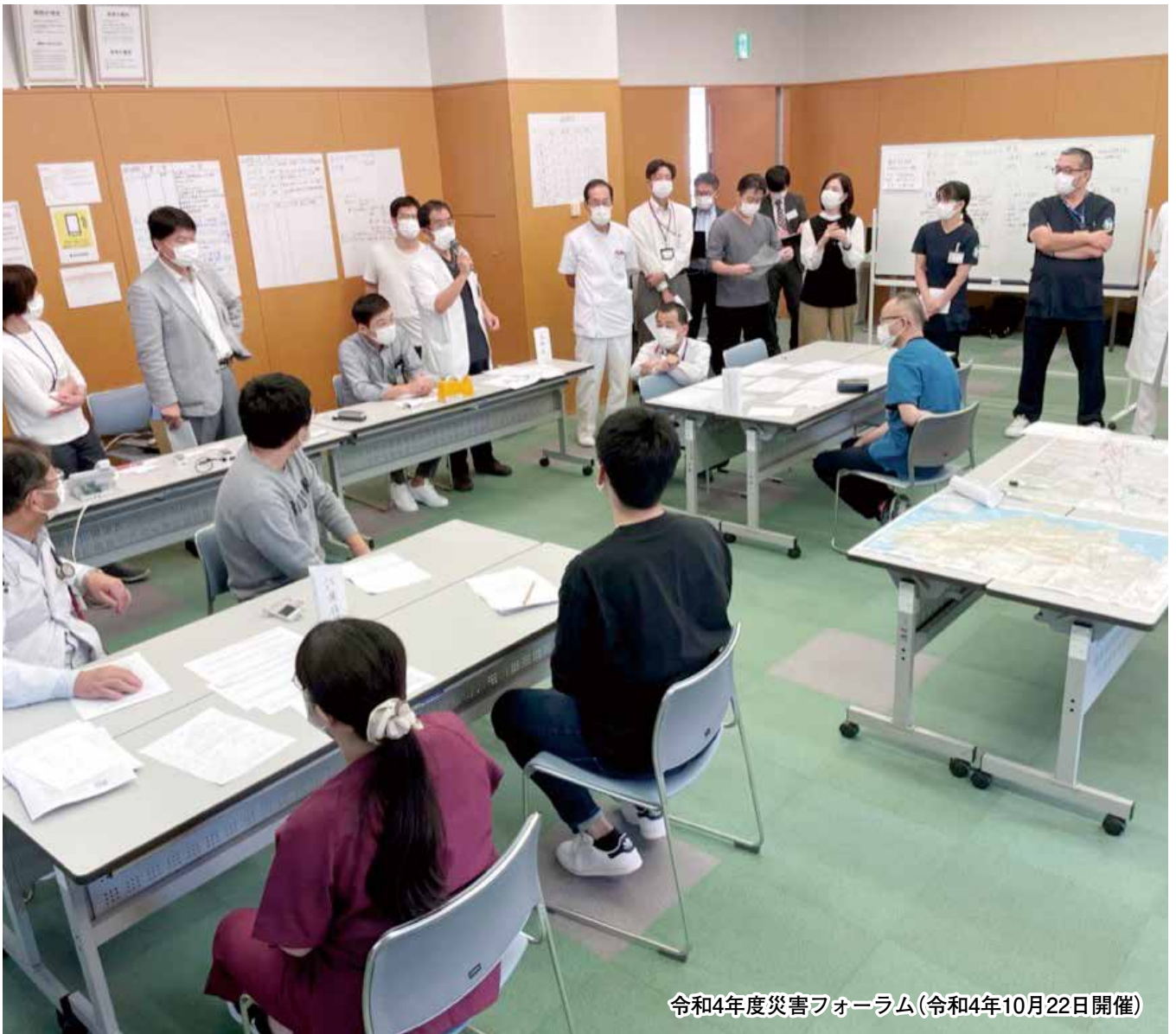
令和4年度災害フォーラム(令和4年10月22日開催)