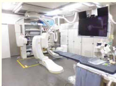
アンギオ（血管撮影装置）

放射線を使用せず、強力な磁石と電波を使って体のあらゆる方向の断面を撮影します。脳や臓器、血管などの柔らかい組織の検査によく使われます。