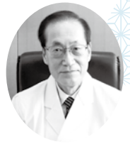
橋本市病院事業 管理者