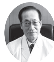
橋本市病院事業 管理者