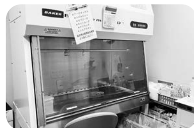
安全キャビネット