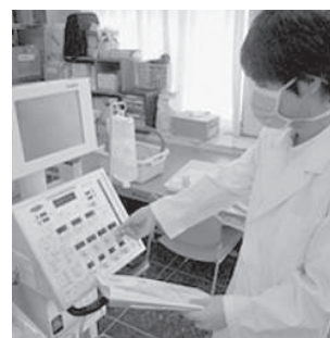
人工呼吸器保守点検