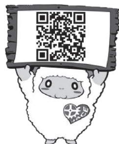
日本臨床工学技士会公認キャラクター「シープリン」