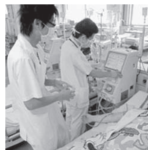
人工透析装置操作