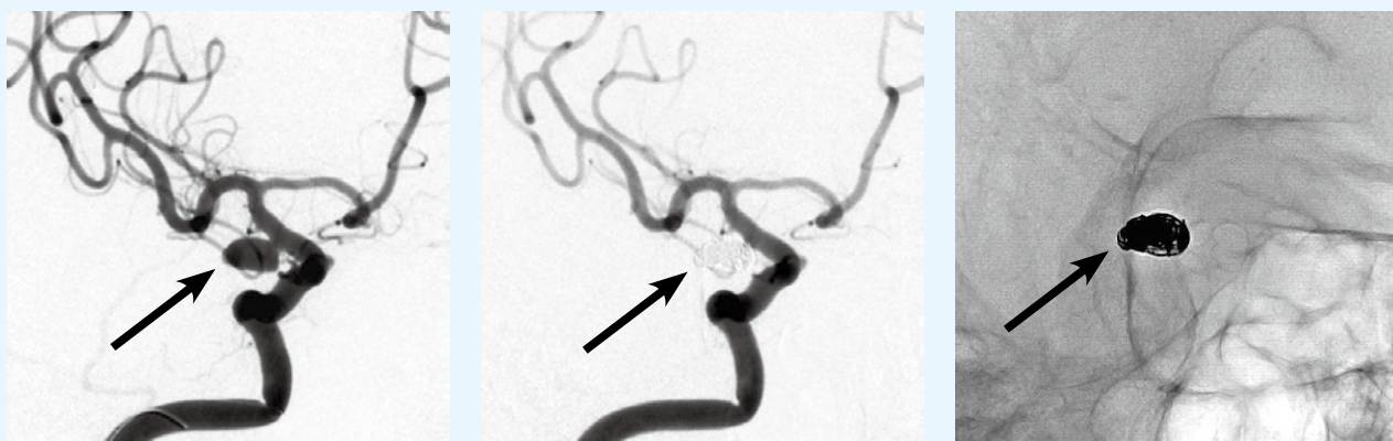
図：脳動脈瘤に対しコイル塞栓術を施行し、動脈瘤が消失している。瘤の中にはコイルが充填されている。

脳動脈瘤が心配で検査を希望される患者さん、偶然見つかったといわれてどうしたら良いかわからないという患者さんなどおられましたらお気軽に脳神経外科にご相談ください。