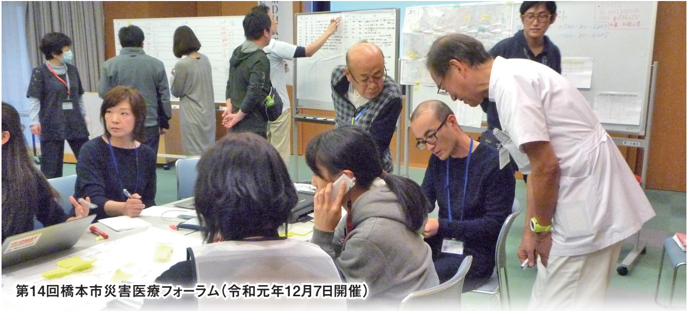
第14回橋本市災害医療フォーラム(令和元年12月7日開催)